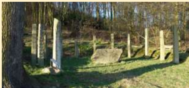
Letzte Station des Kreuzweges

Der Steyregger Kreuzweg wurde mit Unterstützung von Sponsoren aus dem kulturellen Bereich, Industrie, Vereinen und Privatpersonen realisiert.