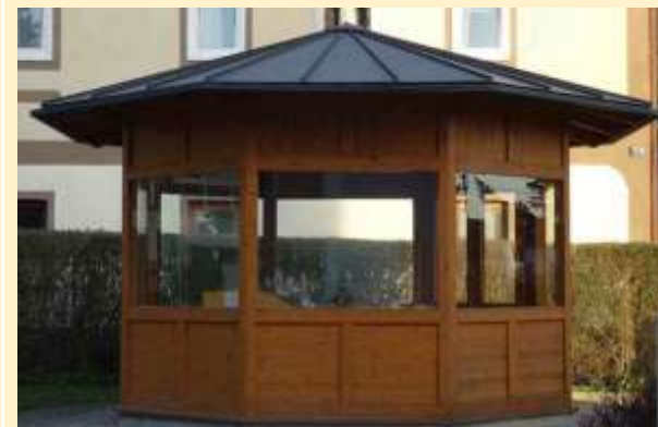
Pavillon des Stadtmodells am Stadtplatz

Der historische Stadtwanderweg führt interessierte Besucher durch die historische Stadt Steyregg. Auch Führungen durch den Nachtwächter sind möglich.