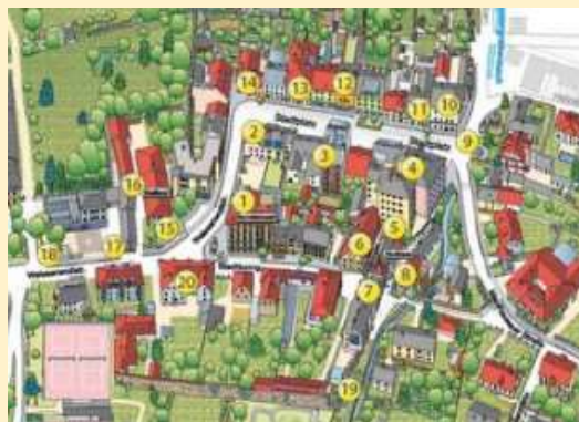
Stationen des Stadtwanderweges

Der Steyregger Kreuzweg wurde mit Unterstützung von Sponsoren aus dem kulturellen Bereich, Industrie, Vereinen und Privatpersonen realisiert.