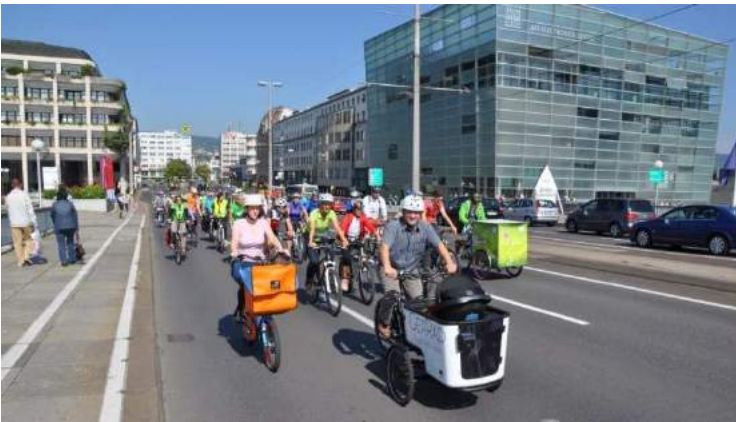
Eindrücke von der Linzer Rad-Parade

Aktuelle Informationen wie Treffpunkte der Sternradfahrt und das Programm der Rad-Parade sind auf www.radlobby.at/sternradln zu finden.