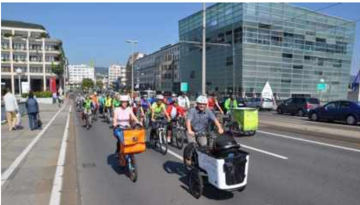
Eindrücke von der Linzer Rad-Parade

Aktuelle Informationen wie Treffpunkte der Sternradfahrt und das Programm der Rad-Parade mit Umweltzirkus sind auf www.radlobby.at/sternradln zu finden.