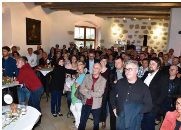
Präsentation der Ergebnisse Zukunftswerkstatt und Bürgerrat

Bürgerbeteiligungsveranstaltung ZUKUNFT.s'Fest! 12. Mai 2016, Panormasaal Schloss Steyregg, 19:30 Uhr