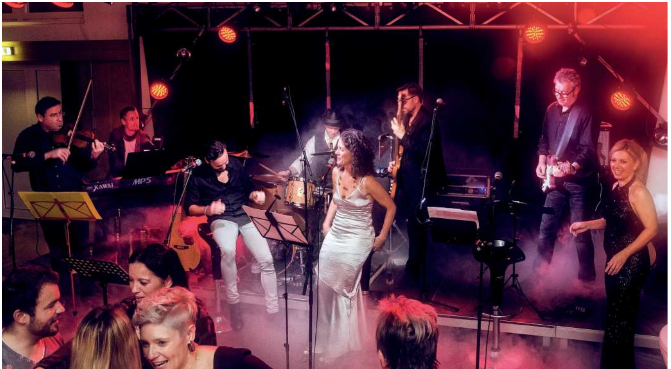
Konzerte der Nächstenliebe jährten sich zum dritten Mal, heuer im Herzen von Steyregg!

Die im Ursprung einfache und unkomplizierte Idee war, aus der Steyregger Musikschmiede Sky Music ein unkonventionelles „Weihnachtskonzert“ von Steyreggern für Steyregger für einen guten Zweck zu veranstalten.