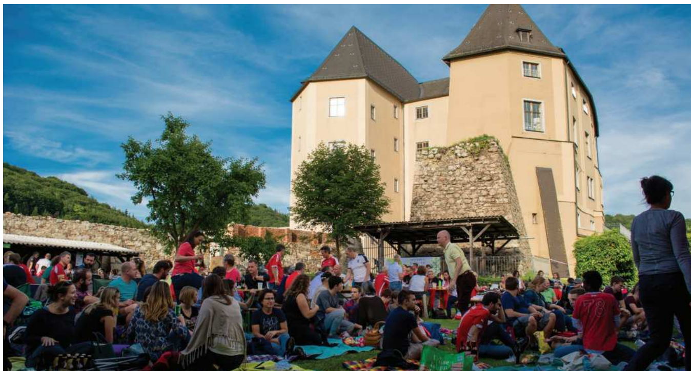
Public Viewing zur EM 2016 im Schloss Steyregg im Rahmen des Agenda21-Prozess