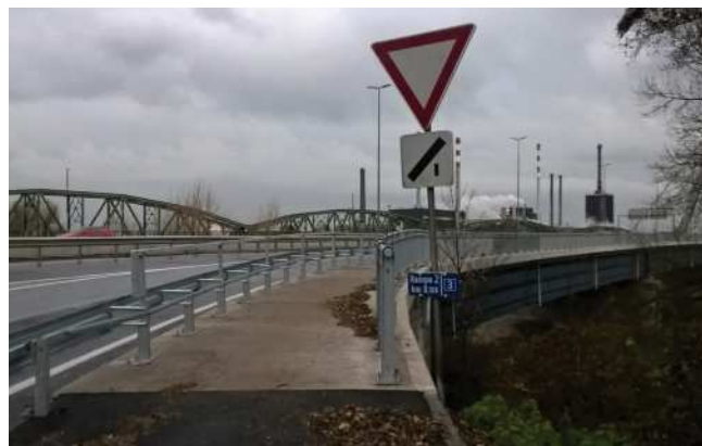
Neuer Radweg oberwasserseitig 2,5m, mit stirnseitigem Gelände wären 50cm mehr Breite möglich!

Ein weiterer Etappenerfolg ist in den Bemühungen um einen radgerechten Ausbau auf der zweiten Seite der Steyregger Brücke bei der Sanierung 2017 gelungen – die von der Radlobby vorgeschlagene stirnseitige Geländermontage wurde geprüft, und erst kürzlich hat uns Herr LR Steinkellner dankenswerterweise die Umsetzung und vollständige Kostenübernahme durch das Land OÖ zugesagt!