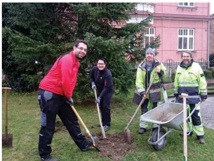
Blumenzwiebeln für einen bunten Frühlingsbeginn

Unser kurzfristiges Ziel ist es, Freiflächen im und um das Stadtzentrum zu begrünen und diese lebendiger zu gestalten. Am 24. November 2016 erfolgte die erste Verschönerungsaktion mit dem Einsetzen von ca. 2.000 Blumenzwiebeln an unterschiedlichen Standorten im Raum Steyregg. Ein blumiger und farbenfroher Start in den Frühling erwartet uns und spendet Kraft und Energie. Ein Dank gilt den Gemeindebediensteten und freiwilligen Bürgerinnen und Bürgern, die tatkräftig bei der Umsetzung mitwirkten.