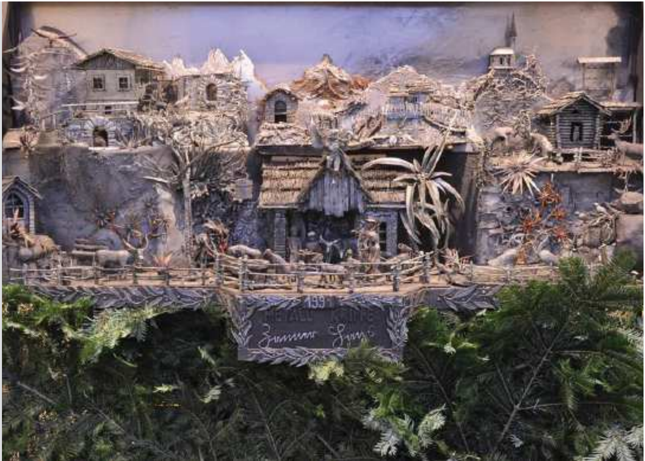
Metall-Krippe geschmiedet von Franz Zauner (näheres im Blattinneren)