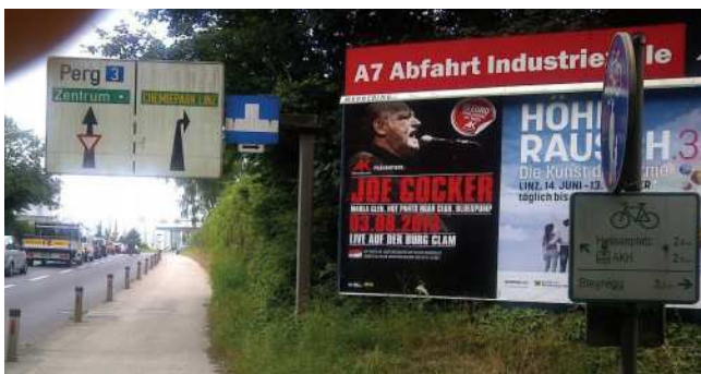
Gefährliche Situation durch bessere Einsicht entschärft

Auch durch mehrere negative Gutachten der Linzer Verkehrsplanung ließ man sich nicht entmutigen, mit Hilfe der Firma Werbering ist dann die Lösung gelungen. In deren Besitz steht die Werbetafel und diese haben auch die Kosten der Versetzung um etwa 200m Richtung Chemiekreisverkehr für mehr Verkehrssicherheit zur Gänze übernommen – herzlichen Dank an die Firma WERBERING!