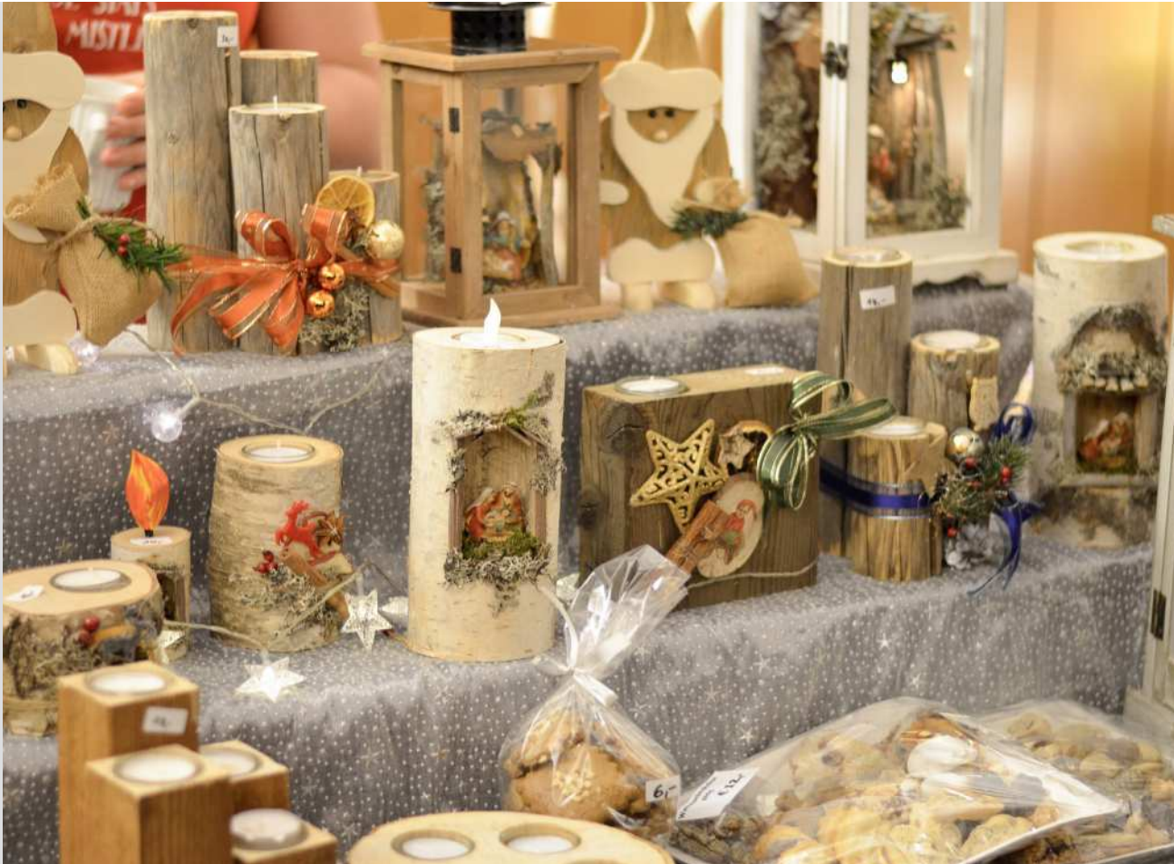
Selbstgemachte Kunstwerke vom Weihnachtsmarkt