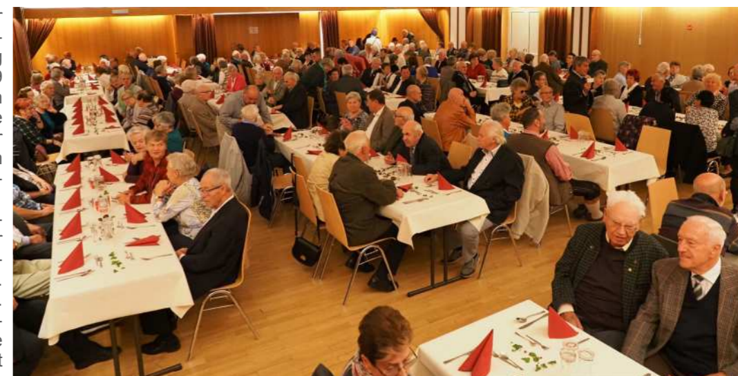
Fotos können jederzeit im Bürgerservice zu den Amtszeiten besichtigt werden.