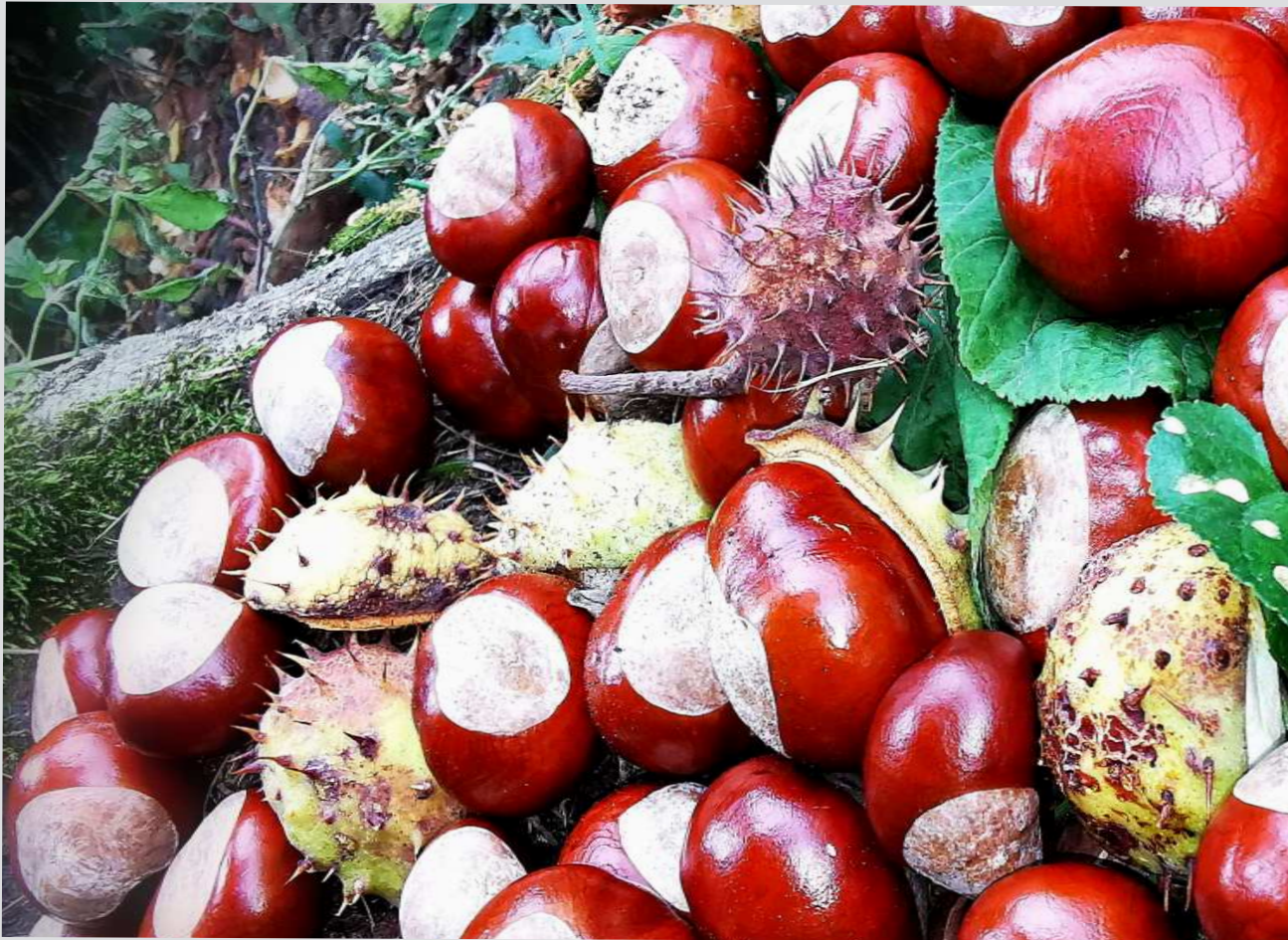
Kastanien, Foto: Johann Kernegger