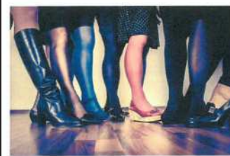
STADTFrauen.LANDliebe.LebensFLUSS Frauengesundheit – Gesunde Gemeinde Steyregg