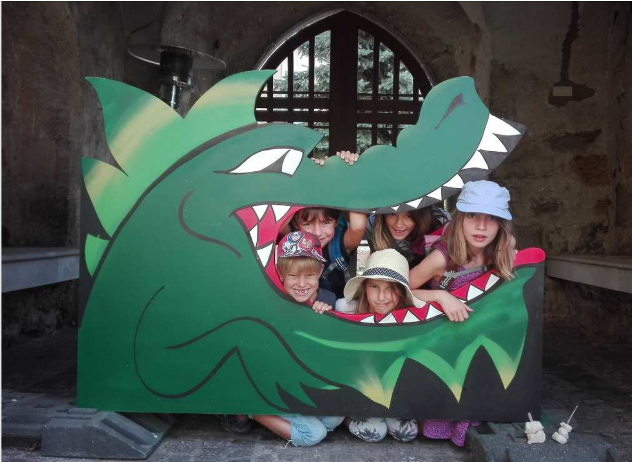
Gesunde Gemeinde, Ferienaktion Land Art