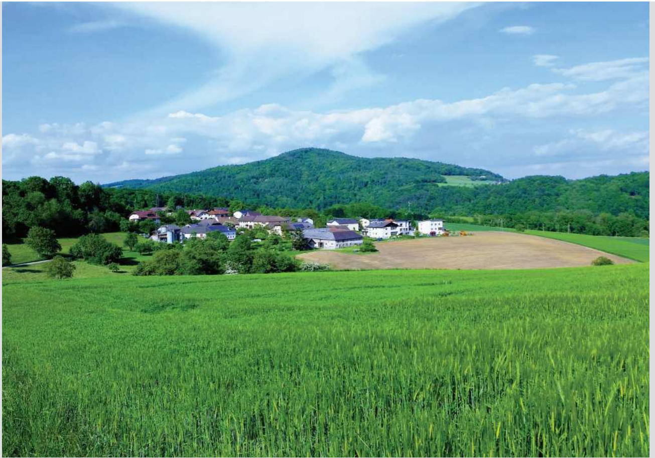
Das malerische Dorf Hasenberg im Sonnenschein