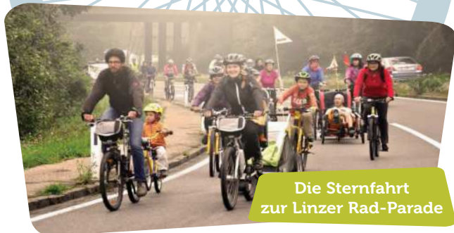
Die Sternfahrt zur Linzer Rad-Parade

Aus über 50 Gemeinden radeln RadfahrerInnen gemeinsam zur Linzer Rad-Parade. Vor Linz gibt es vier Sammelpunkte, ab denen wir öffentlichkeitswirksam auf der Hauptfahrbahn in angemeldeten Konvois zum Hauptplatz radeln.