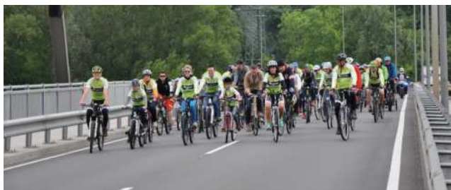
„Mehr Platz für's Rad!“ fordern hunderte RadlerInnen

„Die Sache sei gut geprüft worden, es würden nur