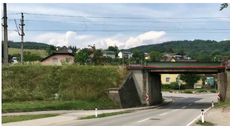
Die Errichtung des Durchgangs neben dem Viadukt verzögert sich von 2018 auf 2020

Um für den Zeitraum bis Sommer 2020 bestmögliche Sicherheit bei der bestehenden Unterführung schaffen zu können, habe ich Experten des Kuratoriums für Verkehrssicherheit (KfV) um einen Lokalausweis gebeten, der auch bereits stattgefunden hat. Sobald die Vorschläge für geeignete Maßnahmen eingelangt sind, werden wir eine Umsetzung in die Wege leiten.