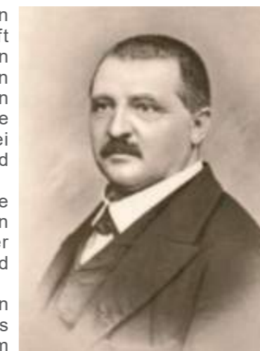
Anton Bruckner im Jahr 1868, als er 44 Jahre alt war.

Auf den oben zitierten Neubau der Orgel erfolgte nachher eine Erweiterung im Rahmen der umfassenden Renovierung und Neugestaltung der Kirche, die ab 1974 stattfand. Auch dazu ein Zitat von Manfred Brandl „Am 23. April 1978