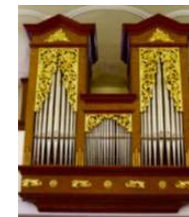
Die Vorderansicht der Orgel stammt noch aus dem Jahr 1863.

Die neue Orgel kostete 1863 knapp 1.000 Gulden. Umgerechnet auf den heutigen Geldwert wären das nur Euro 16.218,--. Steyregg hatte damals ca. 1700 Einwohner. Daraus ergibt sich durch einfache Umrechnung, dass eine von jedem Bürger geleistete Spende von Euro 10,-- die Orgel finanziert hätte. Ein durchschnittlicher Arbeiter (Handwerker) verdiente seinerzeit etwa 1 Gulden pro Tag, das wären heute Euro 16,20. Soweit zur guten alten Zeit! Mit dieser Veröffentlichung kann auch unsere Stadt einen kleinen Beitrag zum Brucknerjahr 2024 leisten.