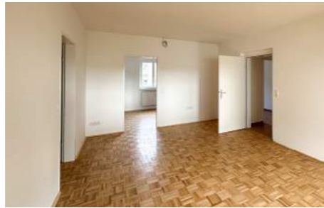
Sicht einer Wohnung in der Förgenstraße

Geräumige Zwei-, Drei- und Vierraumwohnungen mit Wohnflächen zwischen 65 und 90 Quadratmetern bieten für Singles, Paare, Familien oder Wohngemeinschaften genügend Platz und qualitativ hochwertigen Wohnraum.